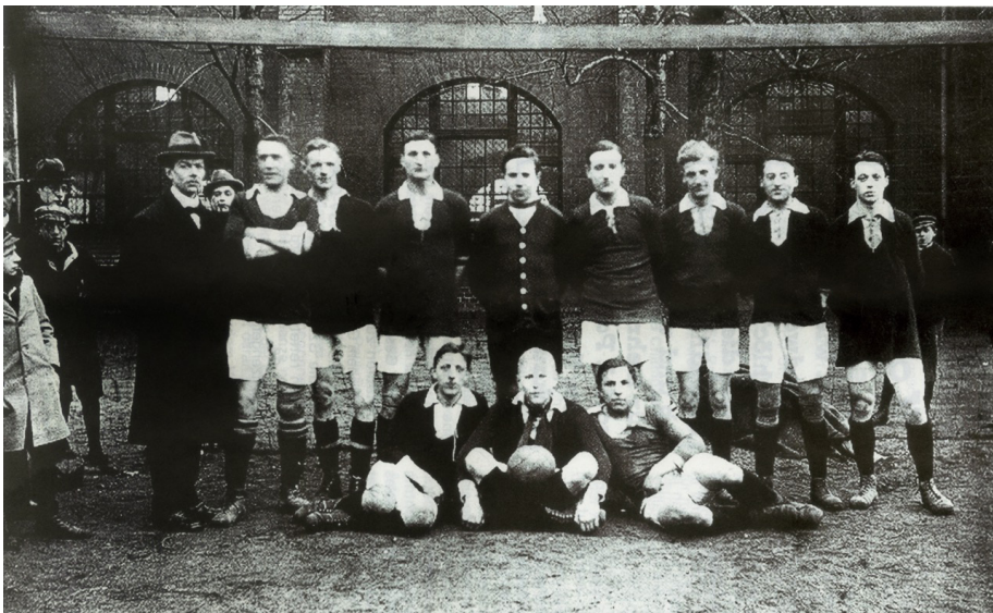
FC ST. PAULI CA 1919: CAHN 2. VON RECHTS